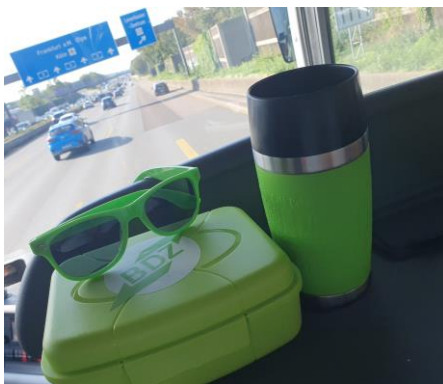
Gut gestärkt Richtung Frankfurt am Main!

Rund 40 Teilnehmende des Bezirksverbands Westfalen haben an dem Ausflug nach Frankfurt am Main teilgenommen und unter dem Motto „Ebbelwoi und Grie Soss“ die Stadt erlebt. Am Samstag startete die Gruppe pünktlich am Dortmunder Busbahnhof Richtung Mainmetropole. Zunächst führte die Fahrt zum Frankfurter Flughafen, den größten deutschen Verkehrsflughafen, gemessen am Fluggastaufkommen. Auf der großen XXL-Tour konnten die BDZler/innen Flugzeugabfertigungen an den Terminals beobachten sowie Starts und Landungen hautnah und aus nächster Nähe erleben.